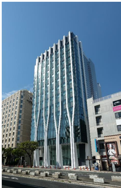
沖縄セルラーフォレストビル